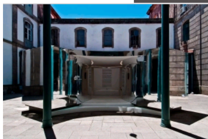
Em 2010, a Design Factory criou um espaço exterior espelhado, estilo "nave espacial"

Jogos e Lotarias Sorteio do Euromilhões (77º2011)